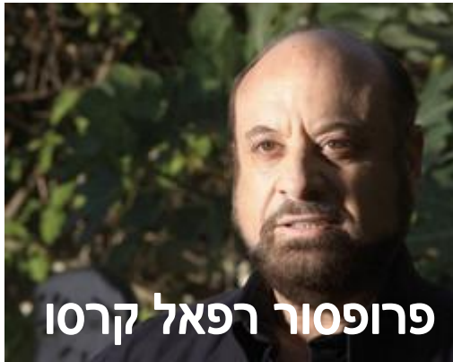
פרופסור רפאל קרסו

אומר פרופסור רפאל קרסו, מבכירי הרופאים בישראל, המתמחה בנוירולוגיה.